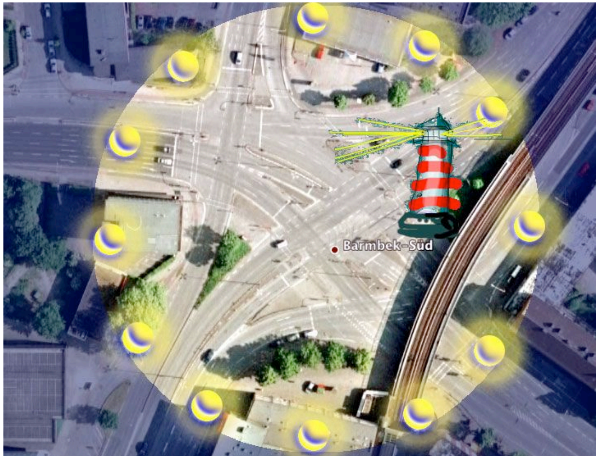
2009: Eine lichte Perlenkette für die Kreuzung Barmbeker Markt/ Dehnhaide